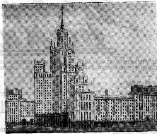
Москва. Высотное здание на Котельнической набережной.

После митинга началась дружная подписка на заем.