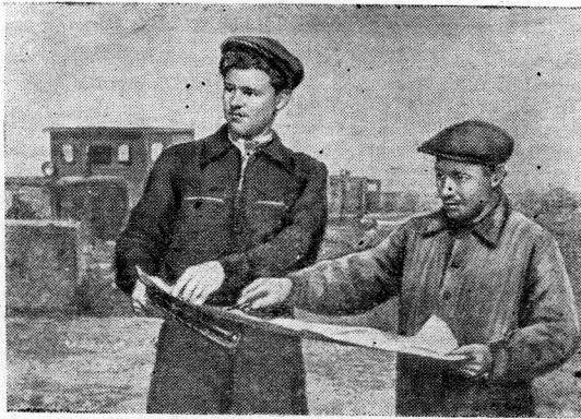
УКРАИНСКАЯ ССР. На строительстве Каховской ГЭС в пойме Днепра началось обвалование берега судоходного шлюза. Работы выполняются мощными бульдозерами.