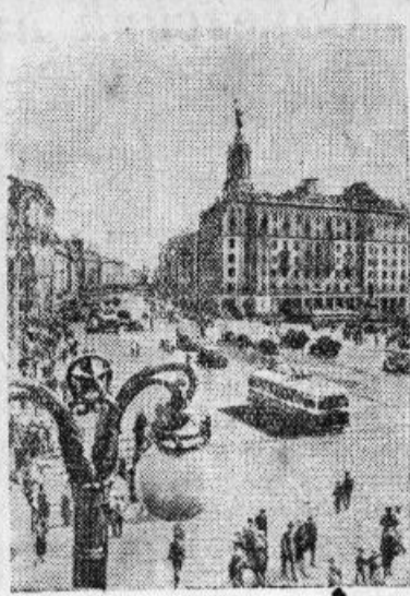
Москва. Площадь Пушкина. Прессклише ТАСС.