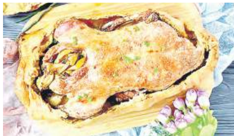
Страницу подготовила Ирина ЖУКОВА

Подавать утку горячей в тарелочке из теста с любым гарниром. Приятного аппетита!