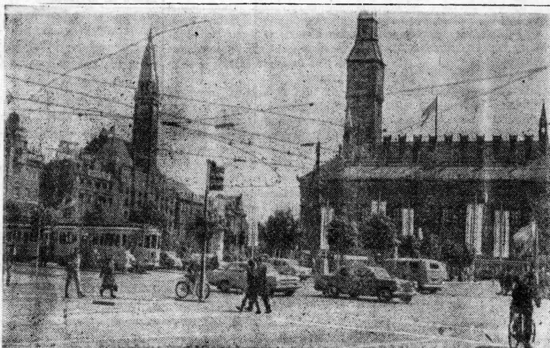
КОПЕНГАГЕН. Площадь Ратуши.