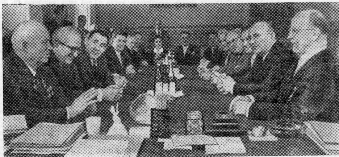
МОСКВА. Первый секретарь ЦК СЕПГ и Председатель Государственного Совета ГДР товарищ Вальтер Ульбрихт и Первый секретарь ЦК КПСС, Председатель Совета Министров СССР Н. С. Хрущев во время беседы.

Доводка трактора ТТ-4 продолжается. Выявленные дефекты будут устранены в третьем квартале 1964 года, а в четвертом квартале по доработанной документации предстоит изготовить опытные образцы для контрольных испытаний, которые намечено провести во втором квартале будущего года. К концу 1965 года должна быть выпущена установочная партия тракторов ТТ-4 и направлена на испытания в лесхозы страны. В 1966 году новый трелевочный трактор будет поставлен на производство.