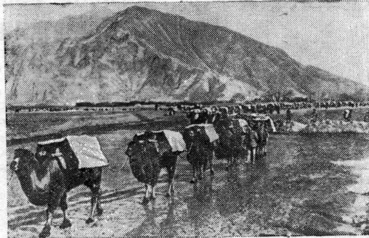
Правительство Китайской Народной Республики проявляет большую заботу о здравоохранении населения Тибета. На снимке: караван с медикаментами, направляющийся в Тибет.