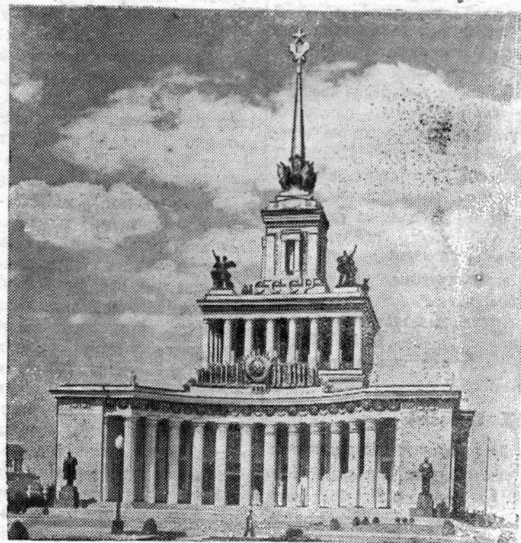
Москва. Всесоюзная сельскохозяйственная выставка. Главный павильон (вид со стороны главного входа).

...Вечером, когда зажглись бесчисленные огни, яркими красками засверкали струи фонтанов, еще величественнее стали белоснежные дворцы — павильоны, окаймленные изумрудной зеленью. С эстрад зазвенели песни народов СССР, песни труда и мира. День открытия выставки вылился в большой всенародный праздник. (ТАСС).