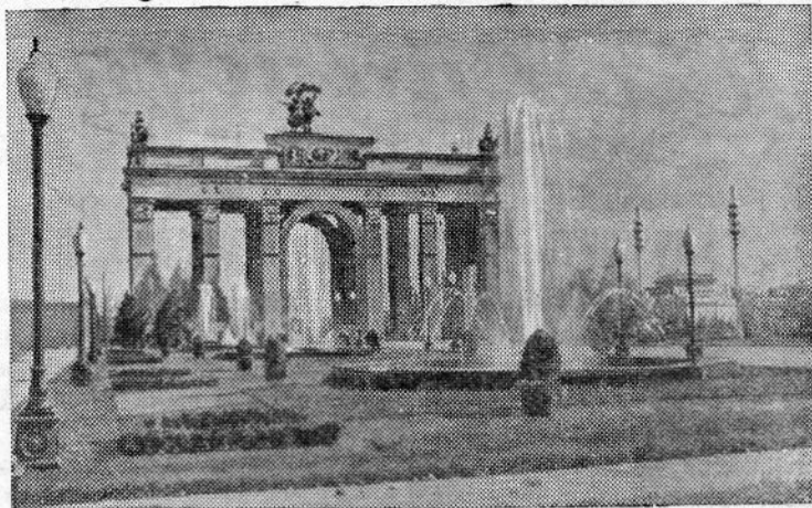
Москва. Всесоюзная сельскохозяйственная выставка. Фонтан у главного входа.

П. ИВАНОВ, начальник механомонтажного цеха АТЗ.