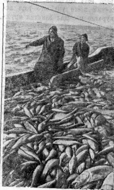
Мурманская область. Экипажи промысловых судов тралового флота управления «Мурманрыбпрома» по примеру москвичей включились в социалистическое соревнование за дальнейшее повышение производительности труда.