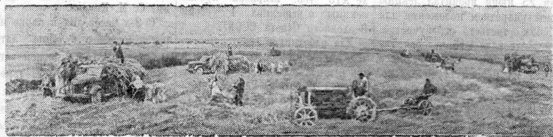
Азербайджанская ССР. Кубахаллидинский мясо-молочный совхоз—один из крупнейших в республике. Он имеет около 2000 голов крупного рогатого скота, из них 720 коров. Работники совхоза уделяют большое внимание созданию прочной кормовой базы. На снимке: покос естественных трав на силос в Кубахаллидинском совхозе.