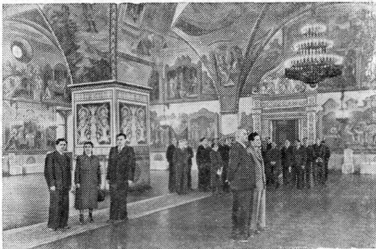
МОСКВА. В Грановитой палате Кремля.

Сейчас перед коллективами подсобных хозяйств стоят ответственные задачи—наряду с сенокосением организовать образцовый уход за зерновыми, огородными и бахчевыми культурами.