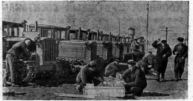
Алтайский край. В недавно созданный Кулундинский зерносовхоз прибывает новая техника. На снимке: механизаторы Кулундинского зерносовхоза получают очередную партию тракторов на станции Кулунда.

Сейчас бригада стремится дать как можно больше муки высших сортов.