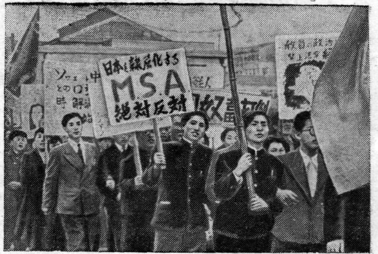
Японская молодежь все активнее и организованнее выступает за мир, против американской оккупации страны. На снимке: токийские студенты на демонстрации протеста против вмешательства американцев в японские дела.