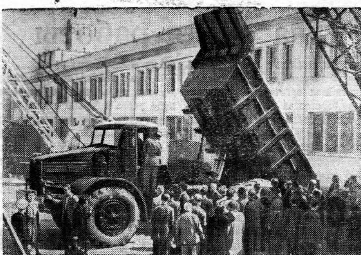
Германская Демократическая Республика. С 30-го августа по 9-е сентября в Лейпциге проходила традиционная международная ярмарка. На снимке: посетители ярмарки осматривают советские грузовые автомашины.