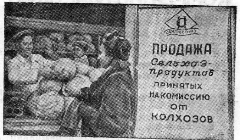
Центросоюз организовал на московских рынках торговлю сельскохозяйственными продуктами, принятыми на комиссию от колхозов.

М. ПОНОМАРЕВ, секретарь партбюро стройтреста № 46.