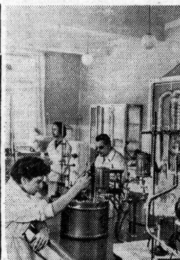
Институт микробиологии Болгарской академии наук уделяет большое внимание изучению микроорганизмов, вызывающих инфекционные заболевания у людей и животных, разработке методов диагностики этих болезней, мер их предупреждения и методов лечения с помощью биопрепаратов.

Миссия связи Вьетнамской народной армии, выразив свой решительный протест против этих нарушений Женевских соглашений, потребовала немедленного прекращения преследования южновьетнамскими властями родственников жертв Фу Лоя.