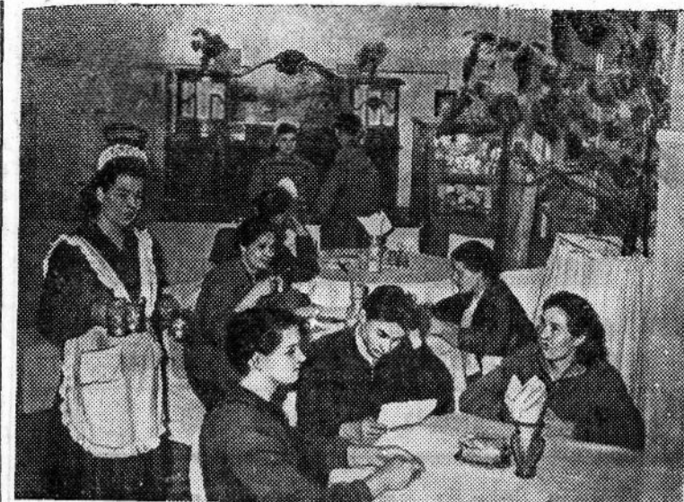
Восточно-Казахстанская область. Десятки новых столовых, закусочных, буфетов, кафе и чайных открыты в Восточном Казахстане за последнее время.

Недавно в городе Зырянске начал работать новый магазин кулинарно-кондитерских изделий. Здесь можно купить пищевые полуфабрикаты, изделия из теста и мяса, рыбные блюда и овощные салаты. Только за один месяц населению продано продукции на 200 тысяч рублей.