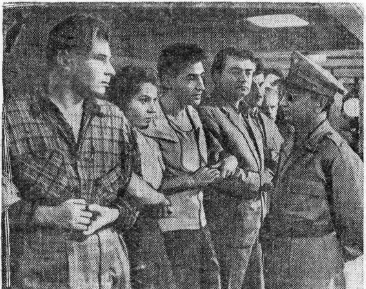
На снимке: кадр из фильма.

Начало сеансов: в 1, 2 ч. 30 мин., 4 часа дня и в 5 час. 30 мин., 7, 8 час. 30 мин., 10 часов вечера.