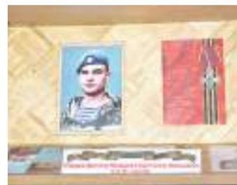
«Сохраняя память». В музее школы № 2 открыли экспозицию, посвященную памяти героя.