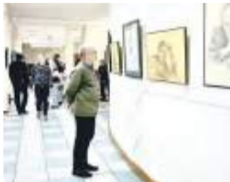
«На грани реальности». Состоялось открытие выставки живописи и графики художников Барнаула.