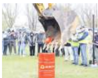
«Праздник профессионализма». В зрелищных состязаниях участвовали двенадцать команд.