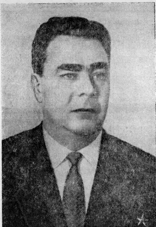
Л. И. БРЕЖНЕВ, Первый секретарь ЦК КПСС.