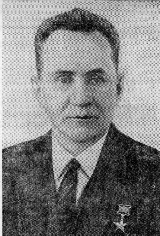
А. Н. КОСЫГИН, Председатель Совета Министров СССР.