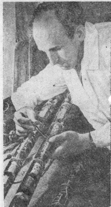
МОСКВА. На заводе «Нефтеприбор» освоено производство новых типов промысловой геофизической аппаратуры.

Дорогие товарищи! Раскройте книгу истории завода и вы многое поймете и оцените, каким был и стал наш поселок. Тем, кто благоустроивал заводские поселки, мы скажем спасибо. А наша смена, будем надеяться, продолжит дела кадровиков и сделает город образцом высокой культуры и чистоты.