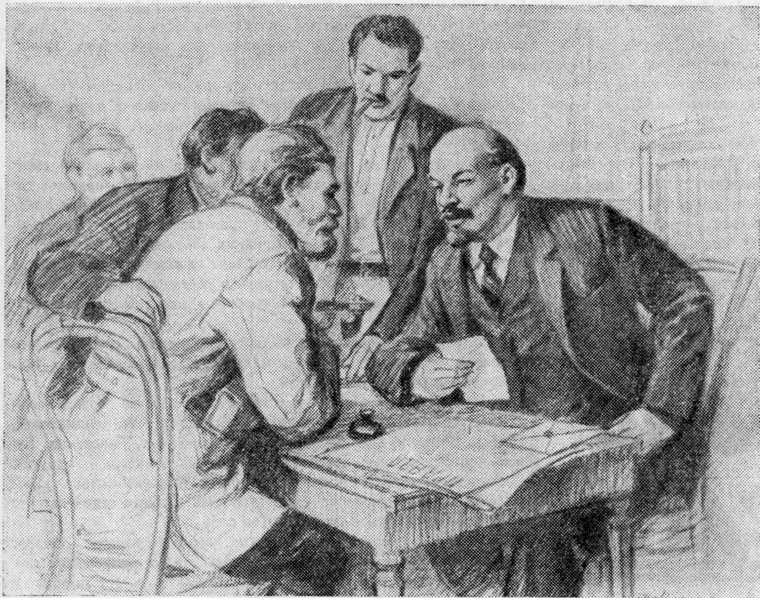
В. И. Ленин беседует с рабочими корреспондентами в редакции газеты «Правда» (1917 г.).