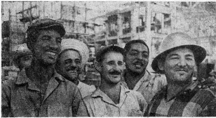
В Республике Куба при помощи Советского Союза сооружается теплоэлектроцентраль «Марнэль», которая будет крупнейшей электростанцией в стране. Мощность ее первой очереди составит 200 тысяч киловатт. После установки намеченных по проекту агрегатов мощность станции увеличится до 500 тысяч киловатт. В строительстве принимают участие советские специалисты.

На снимке: строители электростанции.