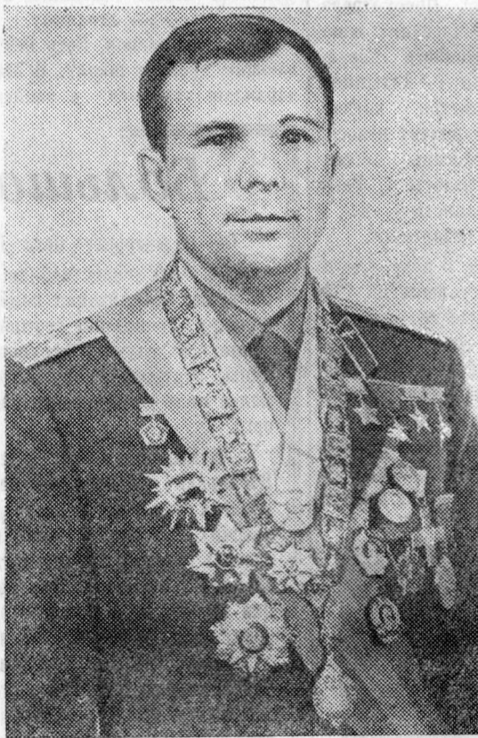
Первый в мире космонавт Юрий Гагарин.

Всеми человечеству памятен день, когда впервые в истории, разорвав путы земного притяжения, взлетел к звездам сын Земли, гражданин Советского Союза коммунист Юрий Алексеевич Гагарин. Люди всех континентов назвали 12 апреля 1961 года утром космической эры. Прошедшие с тех пор три года были заполнены рядом новых блистательных побед советской науки. В августе 1961 года космический рейс на корабле «Восток-2» успешно осуществил второй советский летчик-космонавт—Г. С. Титов. За ним первый групповой многосуточный полет совершили «звездные братья» А. Г. Николаев и П. Р. Попович. Новым триумфом советской космонавтики явился второй длительный совместный рейс в глубины звездного океана—гражданин Советского Союза В. Ф. Быковский и первой в мире женщины-космонавта В. В. Николаевой-Терешковой на кораблях-спутниках «Восток-5» и «Восток-6» в июне 1963 года.