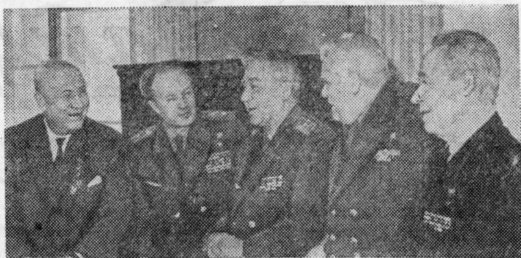
На снимке: первые Герои Советского Союза летчики полярной авиации (слева направо): М. Т. Слепнев, Н. П. Каманин, А. В. Лапидевский, М. В. Водопьянов и В. С. Молоков, принимавшие участие в спасении челюскинцев.

летчики совершили несколько беспримерных по отваге рейсов на льдину и 13 апреля завершили доставку челюскинцев на материк.