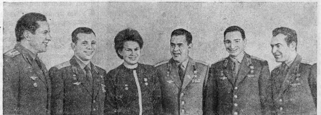
Герои Советского Союза летчики-космонавты (слева направо) подполковник Павел Попович, полковник Юрий Гагарин, Валентина Николаева-Терешкова, подполковник Андриян Николаев, подполковник Валерий Быковский и подполковник Герман Титов.

Выдающиеся успехи нашей страны в завоевании космоса—славная победа труда, мысли и разума советского человека—первооткрывателя космической эры, яркая демонстрация преимуществ социалистического общественного строя. Планомерное освоение советскими людьми просторов Вселенной во имя мира, во имя счастья на земле продолжается.