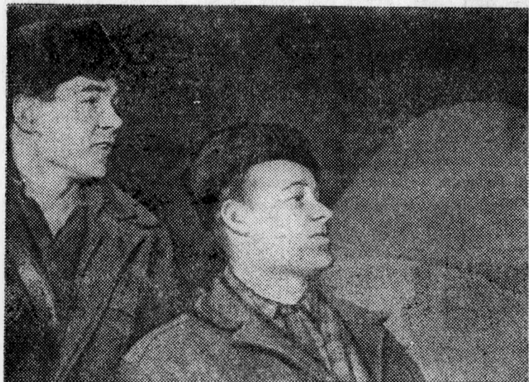
На Воскресенском химкомбинате выдал первые десятки тонн продукции новый цех двойного гранулированного суперфосфата. В этом году цех изготовит тысячи тонн ценного удобрения.

Пленум выразил волю членов партии, рабочих промышленных предприятий, труженников колхозов и совхозов, всех трудящихся Алтая, единогласно одобрив Постановление февральского Пленума ЦК КПСС.