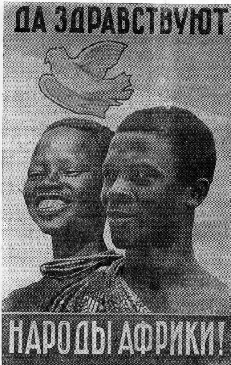
Плакат художника Ю. Берковского.