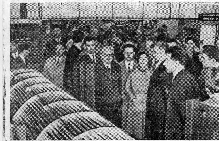
МОСКВА. В парке культуры и отдыха «Сокольники» открылась австрийская специализированная выставка приборов и машинного оборудования. В выставке участвуют 60 австрийских фирм.

Согни работ поступили на конкурс. Кто их авторы? Это мы узнаем после того, как закончит свою работу жюри. Лучшие игрушки передадут предприятиям для массового производства.