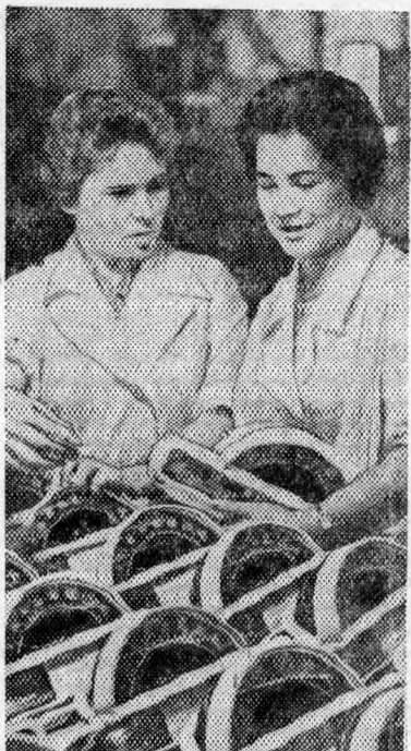
Работники владимирского завода «Автоприбор» взяли повышенные социалистические обязательства в честь 46-й годовщины Великого Октября.

В июле «военная хунта» свергла правительство в Эквадоре. Виднейший главарь этой хунты