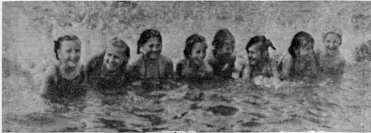
На озере Горьком.