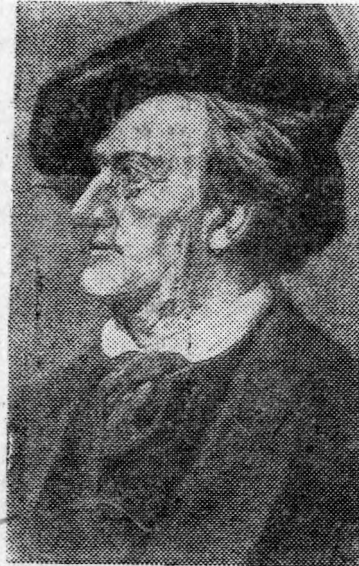
РИХАРД ВАГНЕР—немецкий композитор (1813—1883).