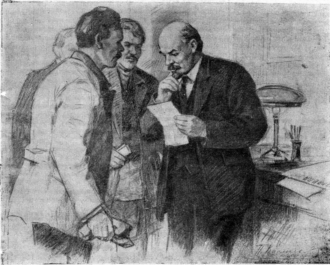
В редакции газеты «Правда» (1917 г.). Рабочие корреспонденты принесли свои заметки В. И. Ленину.