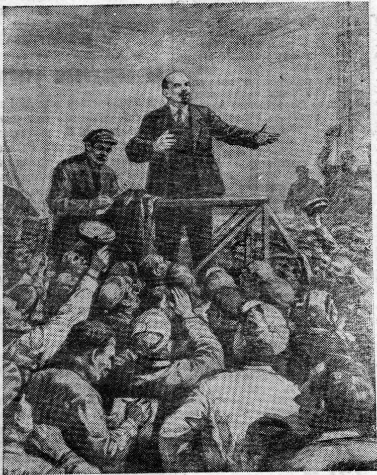
Выступление В. И. Ленина перед рабочими Обуховского завода (1917 г.).