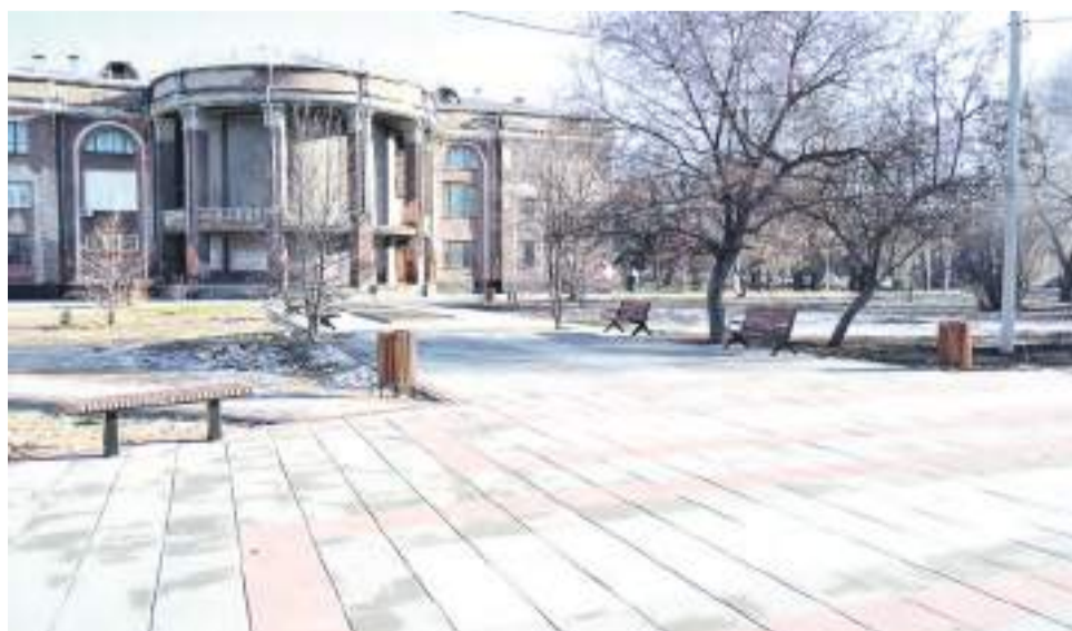
Дом культуры «Алтайсельмаш».