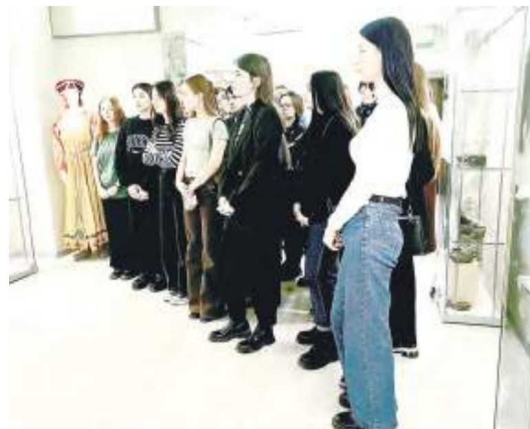
На экскурсии побывали студенты педагогического колледжа.