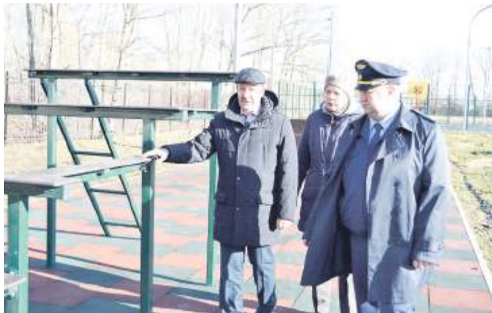
В парке «Патриот» у спортшколы «Юбилейный».

– По результатам проведенных проверок, в ходе ремонта этого объекта прокуратурой города были выявлены наруше-