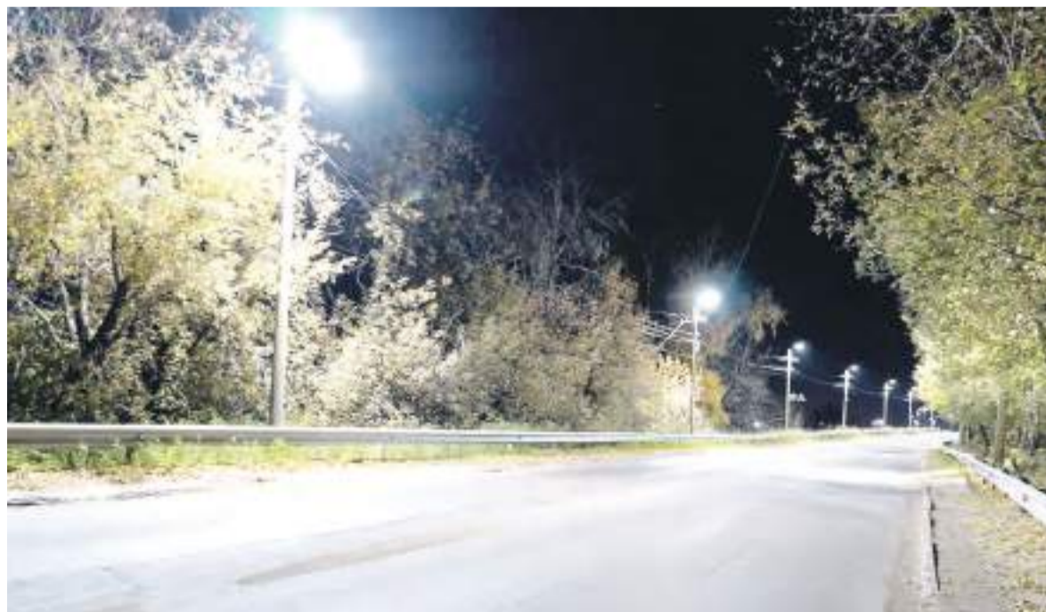
Подготовлено управлением печати и массовых коммуникаций Алтайского края по материалам сайта altairegion22.ru

Также напомним, в сентябре аналогичная установка была введена в эксплуатацию в Благовещенском районе.