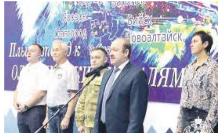
Глава города Дмитрий Фельдман приветствует участников турнира.