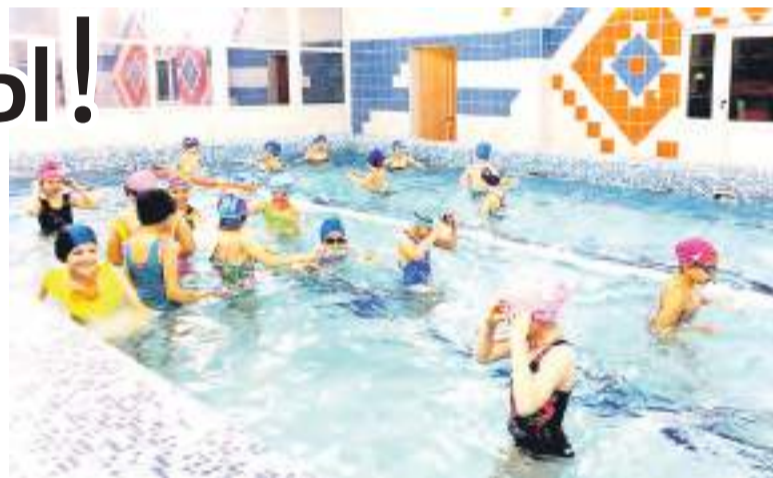
Купание в бассейне – любимое занятие детей!

Кроме того, на основе сотрудничества с социумом дети совершали экскурсии в бассейн «Юбилейный», в клуб технического творчества «Уникум», дважды ребята побывали в Детской городской библиотеке № 2, в боулинге, в «Чудо-саде», к ним приезжал Театр кукол имени