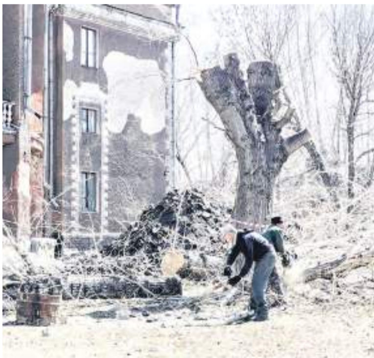
На территории у ДК «Алтайсельмаш» работы идут полным ходом.

– Тут подрядная организация – барнаульская строитель-