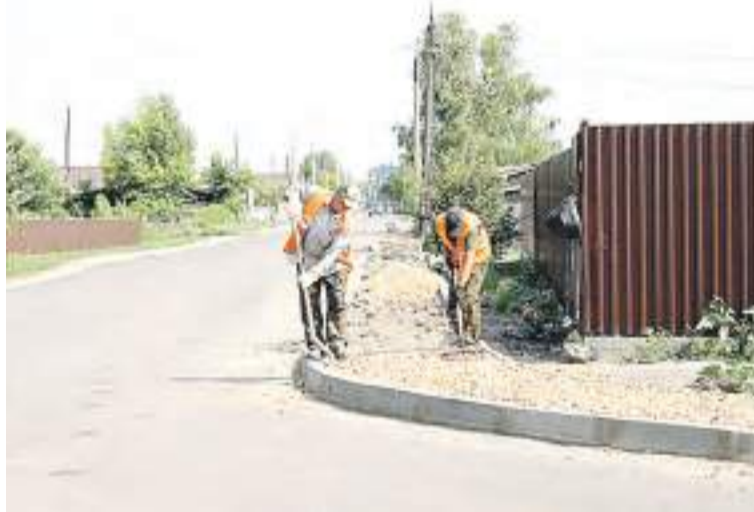
Подрядчики работу выполняют на совесть.

– На сегодняшний день работы по капитальному ремонту