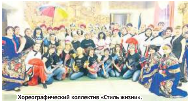
Хореографический коллектив «Стиль жизни».

Евгения АСТАНИНА