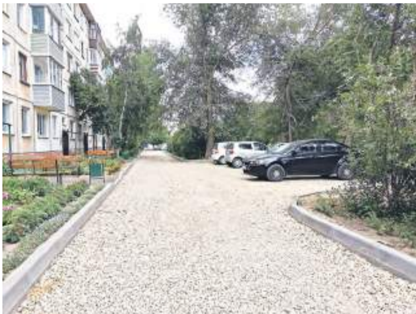
Придомовая территория по пер. Гражданскому, 33.