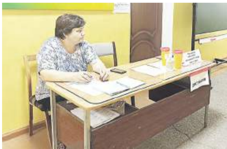
Приём ведётся с соблюдением профилактических мер.