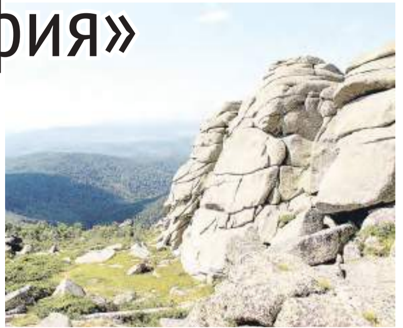
Вид с горы Синюхи. Сотрудники библиотеки собирают фотографии для создания аудиогидов.

Пока маленькие географы отдыхают на летних каникулах, в библиотеке кипит работа. Сейчас сотрудники учреждения собирают фото- и видеоматериалы для создания аудиогидов. Они уже побывали в Горной Колывани, Змеиногорском районе, ленточном бору у села Новоегорьевское. В планах авторов проекта посетить Тигирекский запо-