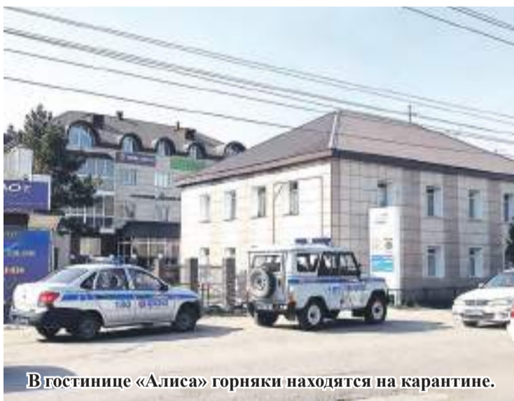
В гостинице «Алиса» горняки находятся на карантине.

В здании рубцовского роддома, который к концу недели станет инфекционным госпиталем для пациентов с коронавирусной инфекцией, завершаются подготовительные работы. Он будет предназначен для больных легкой и средней степени тяжести из Рубцовского округа, сообщили в Минздраве Алтайского края.