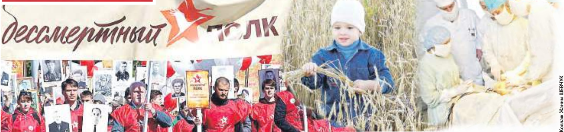
Коллаж Жанны ШЕВЧУК