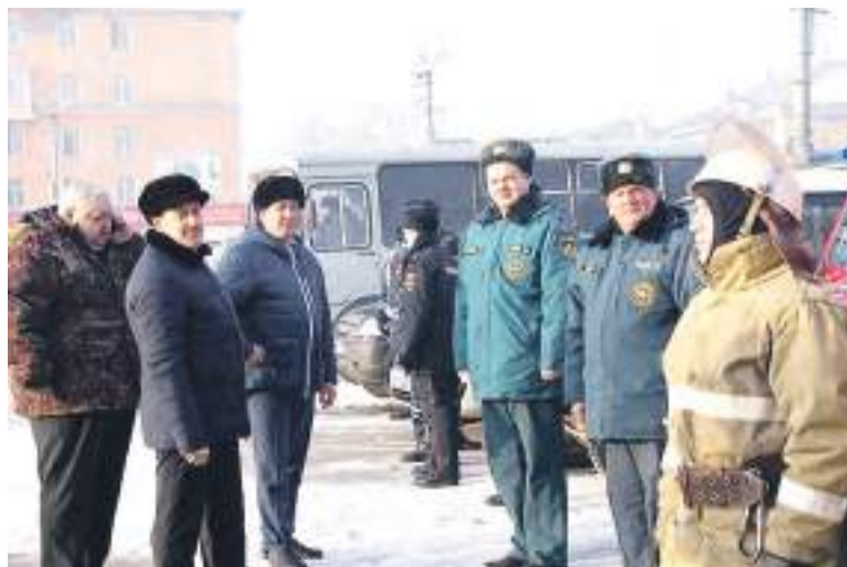
Смотр техники провел Глава города Дмитрий Фельдман.

– Я доволен увиденным, – подвел итог градоначальник. – Техника готова к выполнению