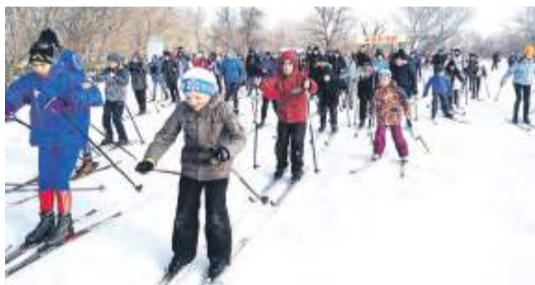
На старт вышли взрослые и дети.

Многие, финишировав, ушли на второй, третий и даже чет-