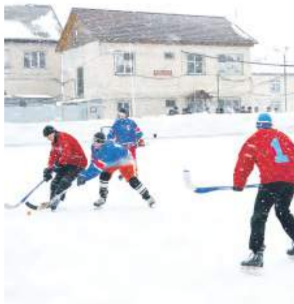
Напряженный момент игры.