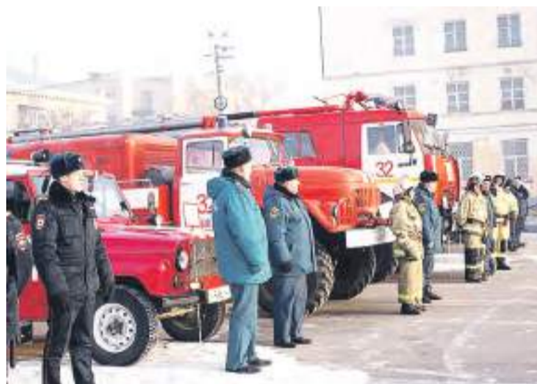
Все силы и средства РСЧС готовы к паводкоопасному периоду.