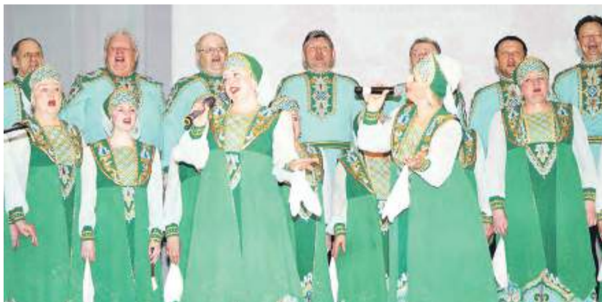
Открыли зональный этап фестиваля хозяева сцены – хор «На просторах Алтая».

По итогам выступлений были определены обладатели наград и