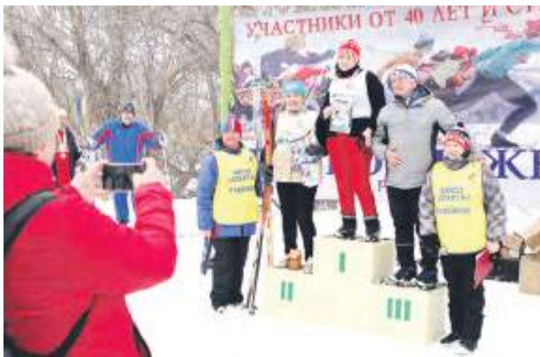
На пьедестале почёта – лучшие.