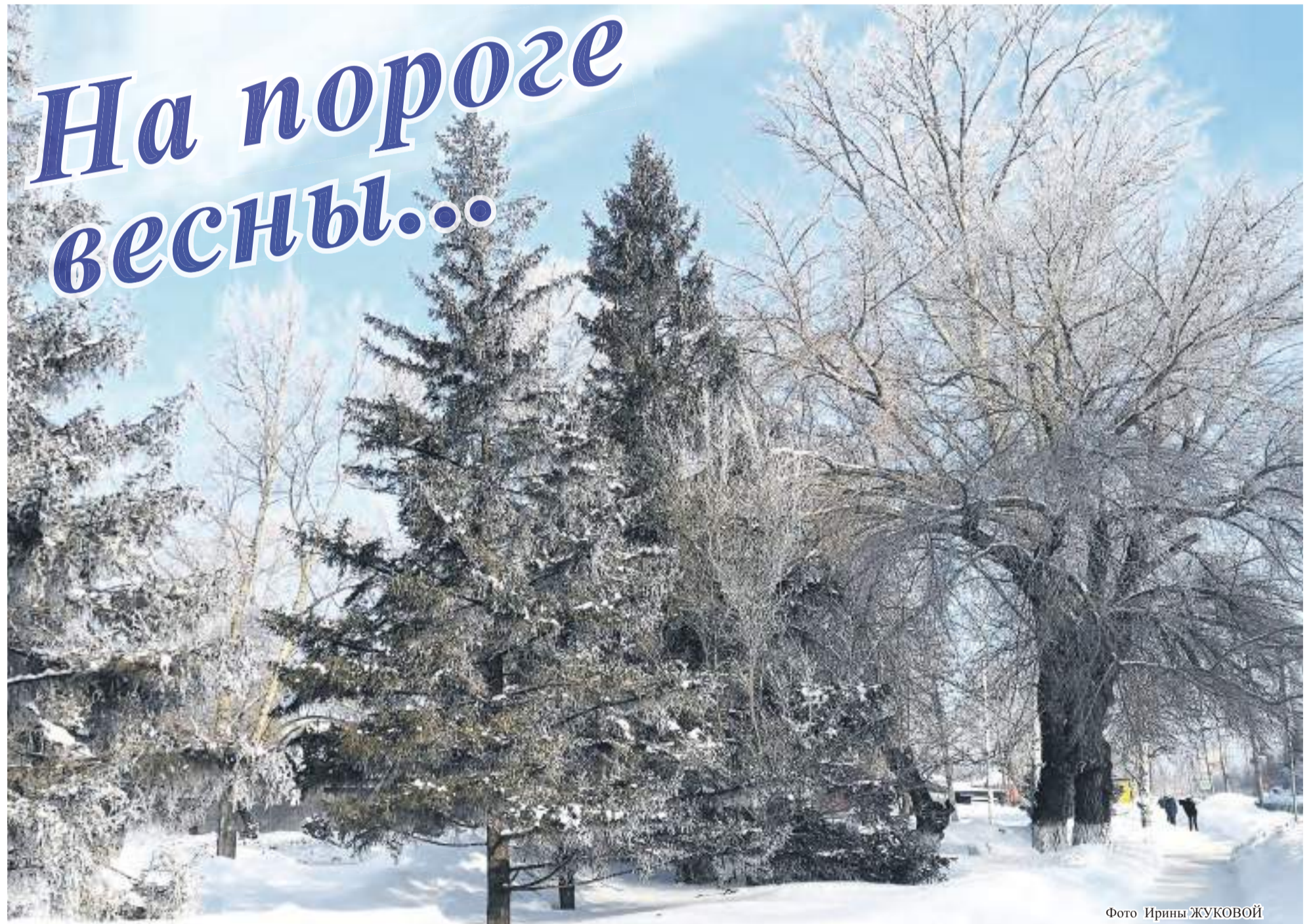
Фото Ирины ЖУКОВОЙ