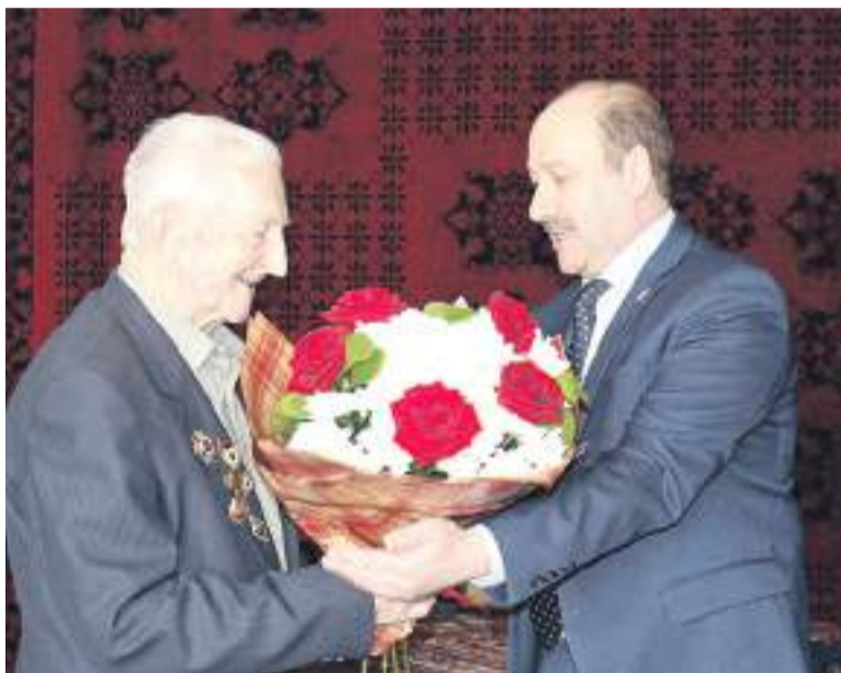
Глава города Дмитрий Фельдман поздравляет юбиляра.