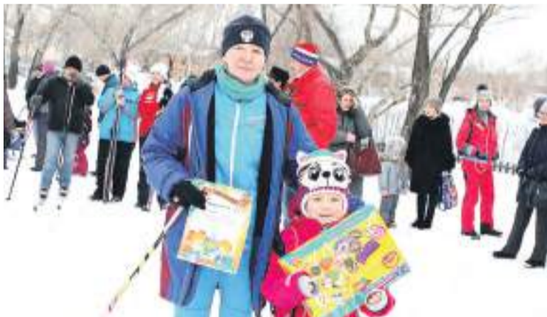
Награда за участие в конкурсе рисунков.