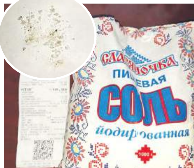
Пачка соли, взятая у читательницы.