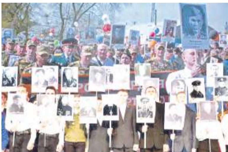
«Бессмертный полк» – основа программы «Я – Память».