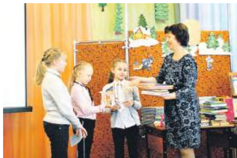
На празднике в детской библиотеке № 2.