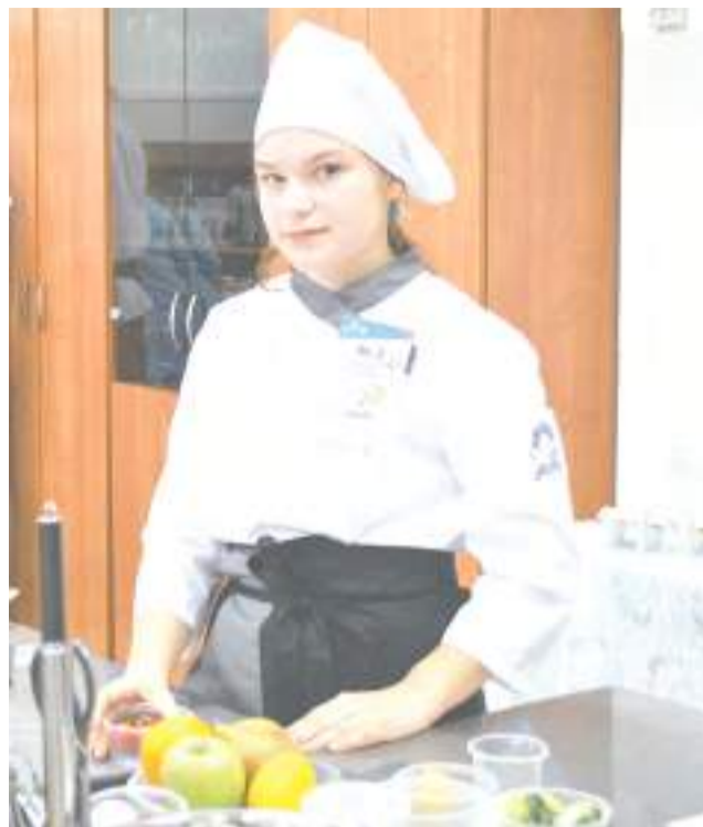
Компетенция «Поварское дело».

В компетенции «Ремонт и обслуживание легковых автомобилей» необходимо было справиться с тремя заданиями. Практические