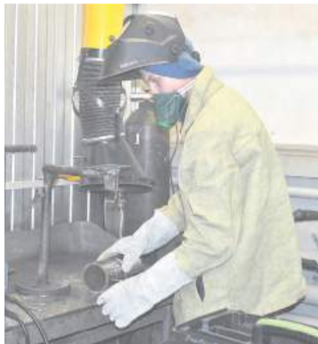
Компетенция «Сварочные технологии».