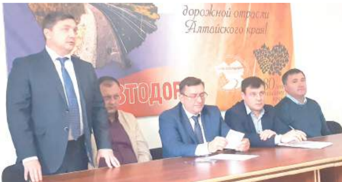
Участники встречи отвечают на вопросы.

Ирина ЖУКОВА