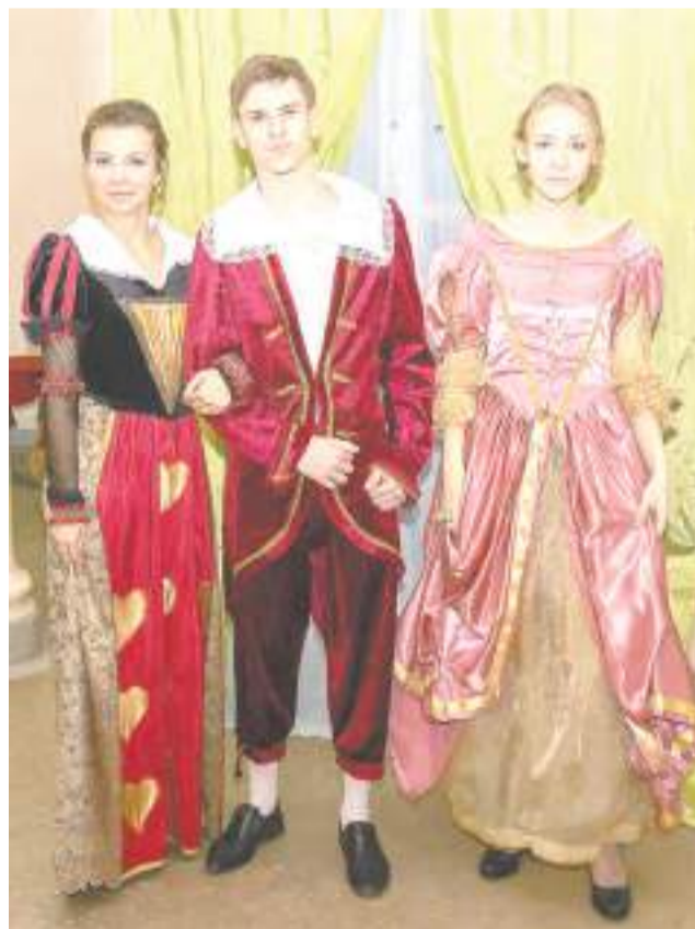
Рубцовск в очередной раз стал местом проведения масштабной Всероссийской акции «Ночь искусств» под девизом «Искусство объединяет». По традиции в нашем городе в этот день, 3 ноября, открылось сразу несколько площадок.

В Доме культуры «Алтайсельмаш» гостей в фойе встречали молодые артисты в красочных костюмах. Все желающие могли сфотографироваться с «живой статуей» в «Театральной гостиной». Здесь же работала творческая мастерская «Чудо