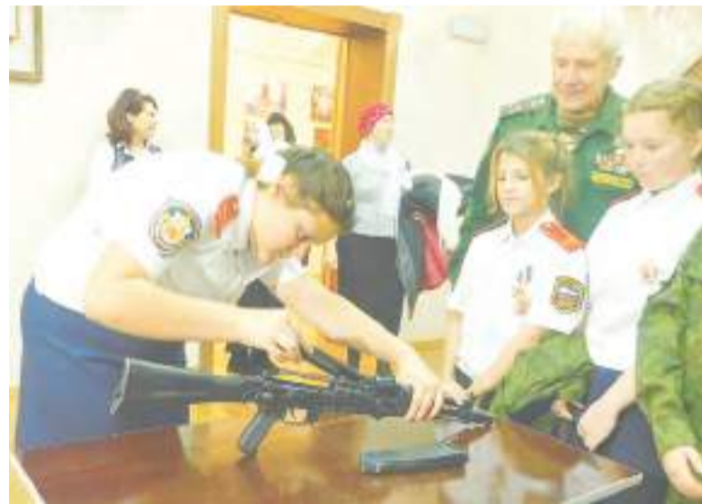
Кадеты с легкостью разбирают и собирают автомат.

25 октября в Курье состоялось историческое событие – освяще-