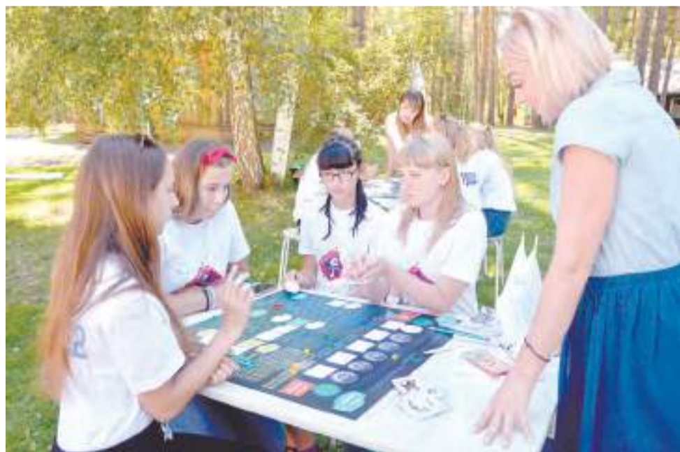
Подготовлено управлением печати и массовых коммуникаций Алтайского края совместно с Министерством образования и науки Алтайского края