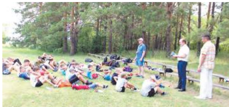
Спортивные занятия на свежем воздухе.