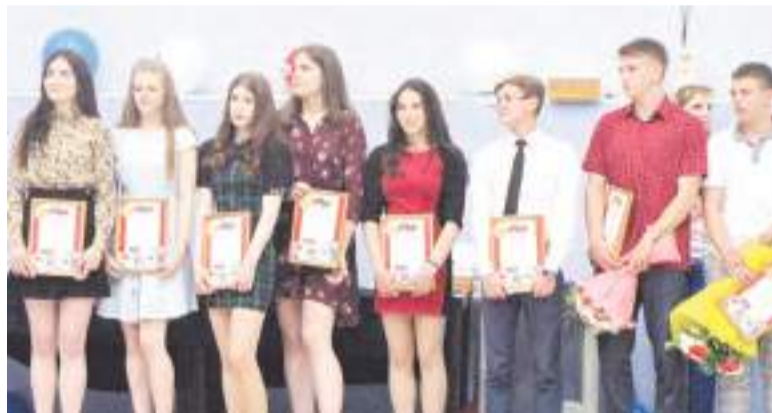
Многих спортсменов «Юбилейного» наградили грамотами.

Татьяна КОКОТОВСКАЯ, фото Максима ДОБРОВОЛЬСКОГО