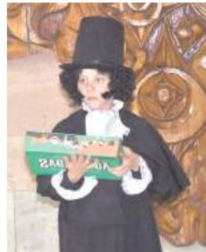
На праздник пришёл юный Пушкин.

Пушкинский день России – праздник, посвящённый памяти великого поэта, – отмечается ежегодно 6 июня. А во всём мире эта дата – Международный день русского языка. Он учреждён департаментом ООН по общественным связям. Так что это – двойной праздник.