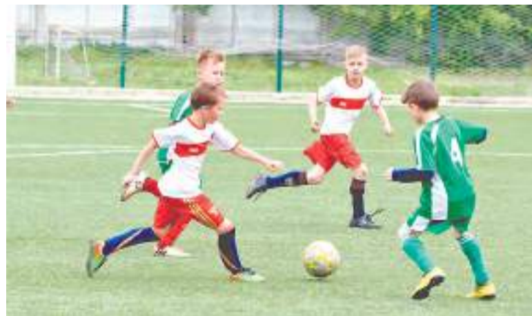
Игровой момент на поле.

Татьяна МЕЛЬНИКОВА, фото предоставлено СШ «Рубцовск»