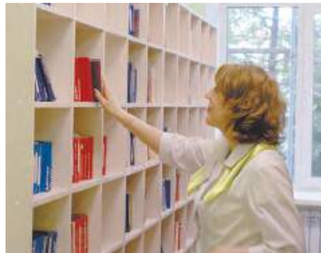
В поликлинике появилось новое картоохранилище.