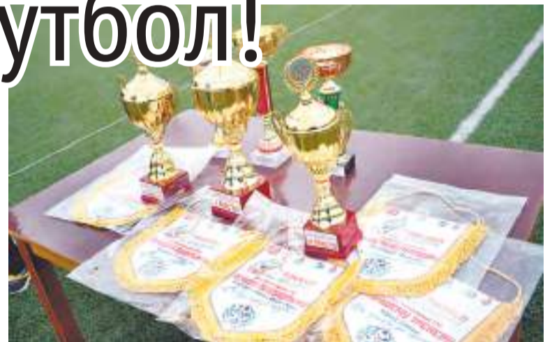
Награды для победителей и призёров.

Далее собравшихся на площадке ждал несколько неожиданный поворот: их приветствовали сказочные герои – актёры