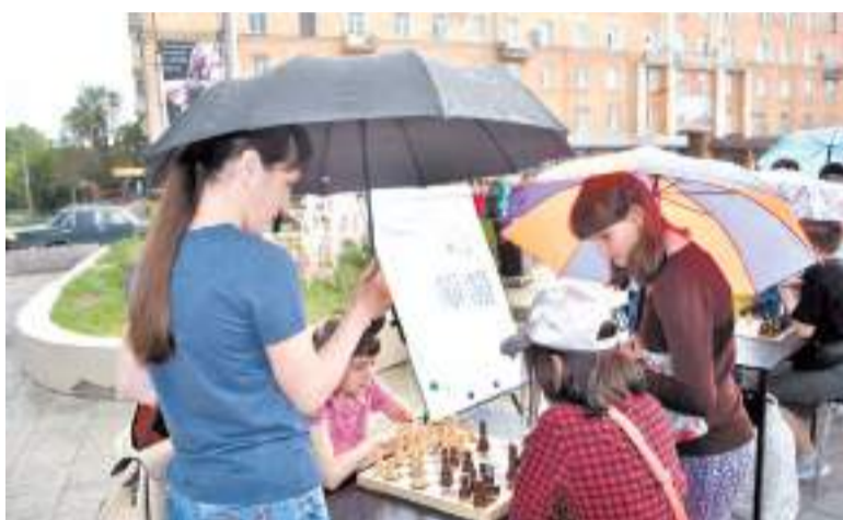
Дети с большим удовольствием играли в шахматы и рисовали.