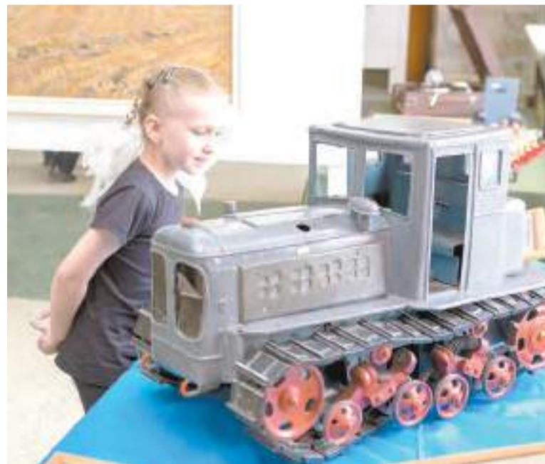
Интерес зрителей вызвала экспозиция в фойе ГДК – макеты техники, фотографии, картины.