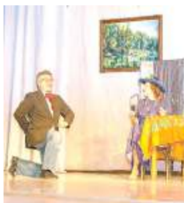
Любви все возрасты покорны.

Сюжет на первый взгляд незамысловат: мошенница-гадалка пытается выманить у других героев спектакля деньги, и нередко ей это удаётся. Тема стара как мир: люди во все времена попадались