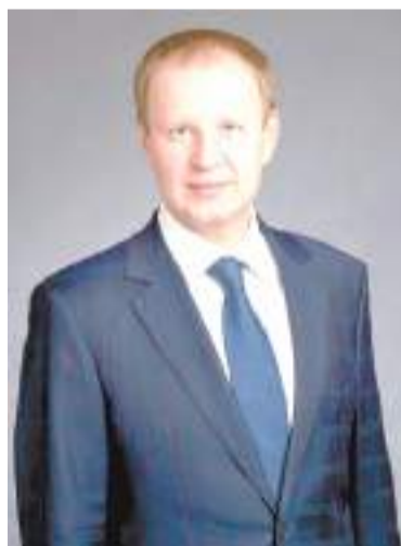
Виктор ТОМЕНКО, Губернатор Алтайского края:

«Необходимо улучшить качество и отремонтировать больше дорог. То, чем пользуются люди здесь и сейчас, нужно приводить в порядок. Важно также знать, что все эти средства направляются на конкретные участки, дороги и объекты. Нужно использовать денежные ресурсы так, чтобы не было нареканий в наш адрес».