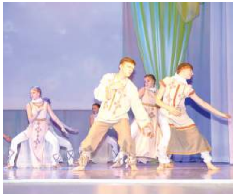
В подарок – творческий номер.

Нынешний год – юбилейный год освоения целины. 65-летию этого знаменательного события была посвящена концертно-тематическая программа, состоявшаяся в Городском Дворце культуры 5 апреля. В нашем городе это первое из множества мероприятий, которые запланировано провести в течение года.