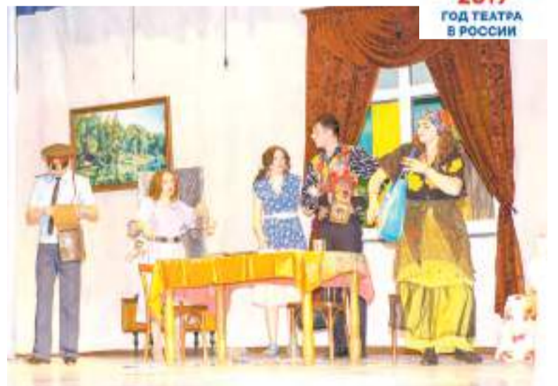
Разоблечь мошенницу оказалось не так просто.

Поклонники творчества театра «Экспресс» привыкли к тому, что в спектаклях обычно задействовано