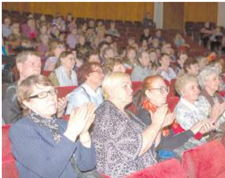
В зале – благодарные зрители.

Целинники без устали трудились от зари до зари, но по вечерам молодёжь собиралась на свободных площадках возле своего временного жилья, и усталости словно не бывало – начинались песни под баян и гармошку, частушки, танцы.