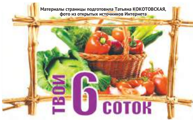
Материалы страницы подготовила Татьяна КОКОТОВСКАЯ