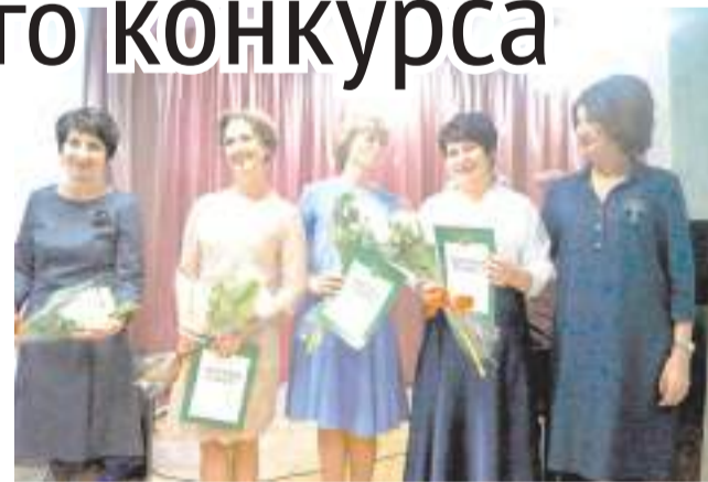
Коллектив библиотеки удостоен многих наград.

Особого внимания заслуживает масштабный проект «Читай Алтай», направленный на продвижение издательского проекта «Алтай. Судьба. Эпоха» и антологии «Образ