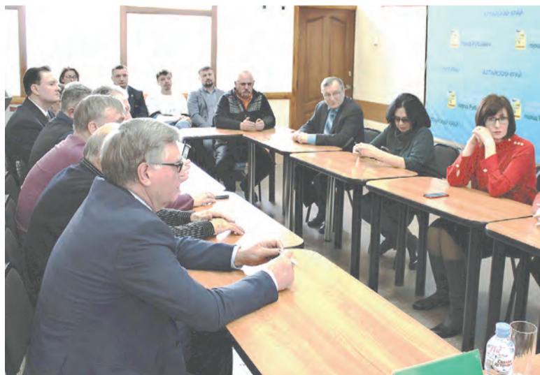
Участники обсудили пути совместной работы.

Состоялось совместное заседание представителей Администрации Рубцовска, общественности, руководителей организаций и учреждений города, АКОО «Рубцовская коллегия по оказанию социальной помощи населению».