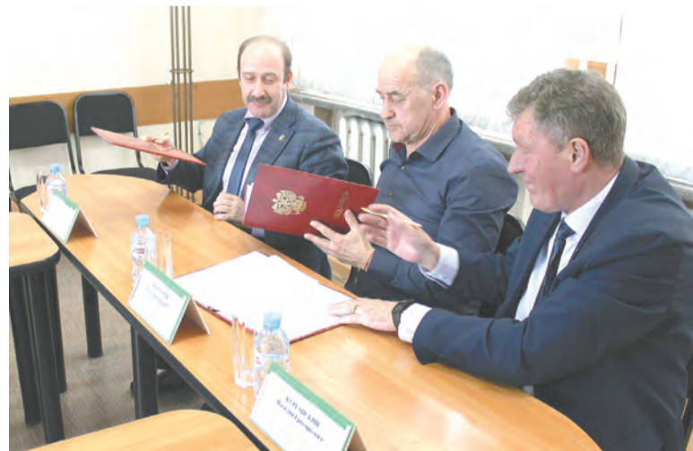
Момент подписания документа.

Участники заседания обсудили пути взаимодействия АКОО «Рубцовская коллегия по оказанию социальной помощи населению», органов местно-