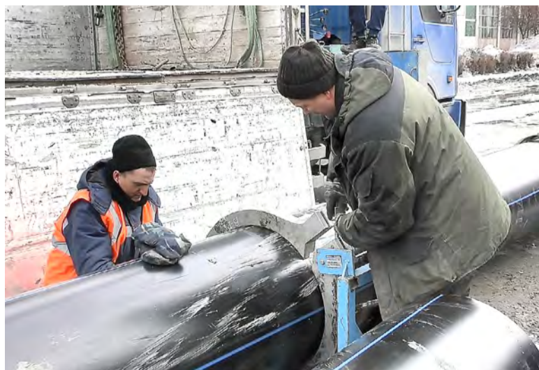
Монтаж трубы нового коллектора.