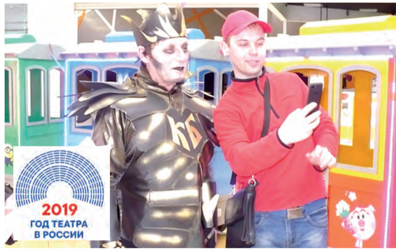
Многим из посетителей удалось сделать селфи с Кощей.

Между тем Кощей в сопровождении двух охранников, Адьютанта и Секретаря чинно прошествовал в супермаркет «Мария-Ра», где выбрал для покупки ёмкость с минеральной водой (видимо, живительной). Затем сказочный чародей на кассе расплатился за покупку с помощью платиновой карты «Кощей-банк», галантно вручил девушке кассиру нежную розу и направился к выходу. Но... Встреча с таким посетителем торгового центра была для окружающих столь необычной, что Кощею просто так удалиться сразу не удалось. Кто-то просил сделать селфи, кто-то отчаянно снимал происходящее на камеру смартфона... Словом, интерес к визиту сказочной компании был настолько искренним, что Кощей