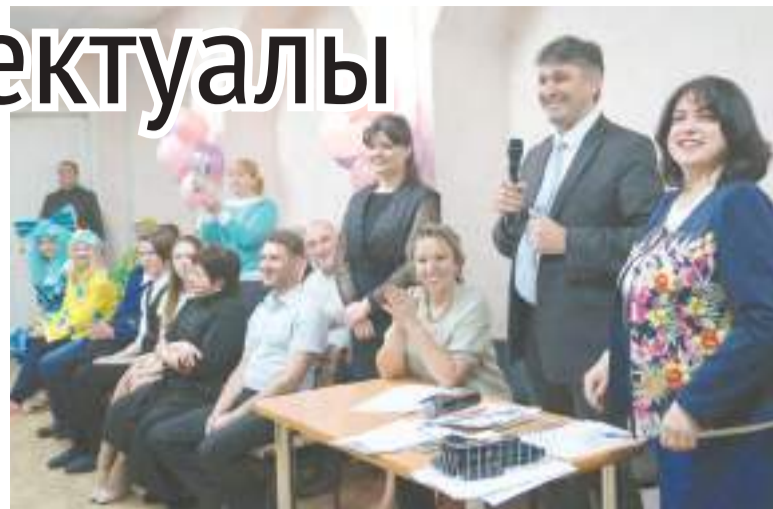
Нестрогое, но справедливое жюри брейн-ринга.

Сама игра состояла из пяти раундов, затрагивающих различные грани сценического искусства. Участники блеснули знаниями интересных фактов о театре, поговорили о русском и зарубежном творчестве, отгадывали имена актеров, названия спектаклей, эмблемы и внешний облик театральных зданий. Соревнующиеся команды и сами