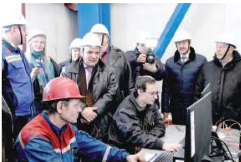
Сердце станции – щит управления.