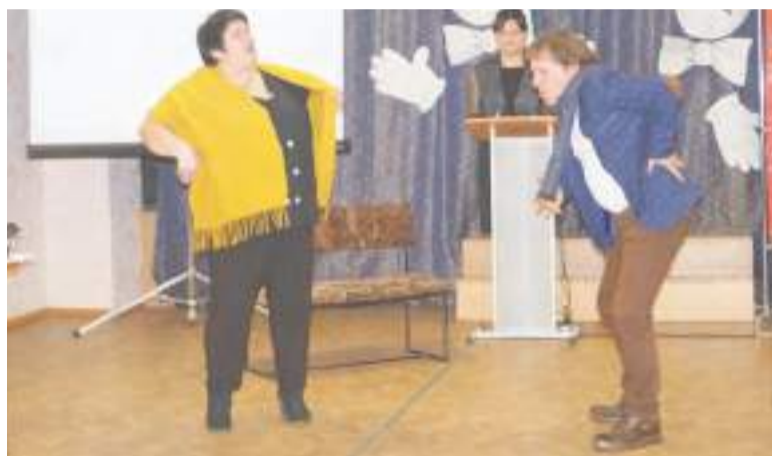
Зажигательная импровизация от победителей игры.