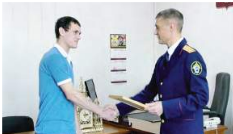
Награда нашла героя.