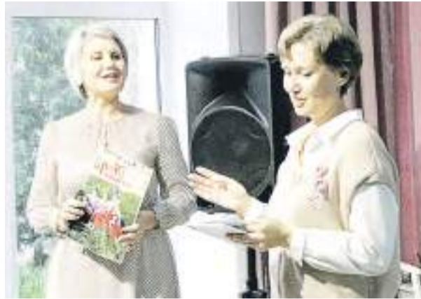
Презентация журнала «Браво, Рубцовск!».

Когда Рубцовск отмечает свой день рождения, есть в череде торжественных мероприятий одно, отличающееся от других. Это презентация печатной продукции, которая традиционно проходит в стенах отдела искусств Центральной городской библиотеки.