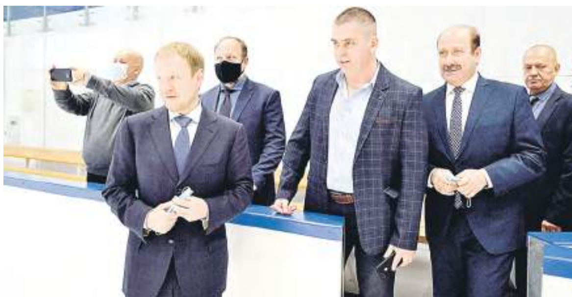
Виктор Томенко посетил «Гимаев-Арену», пообщался с юными хоккеистами и тренерами.