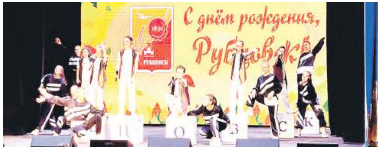
Под одобрительные аплодисменты выступали творческие коллективы.

Ирина ЖУКОВА, фото автора и Максима ДОБРОВОЛЬСКОГО