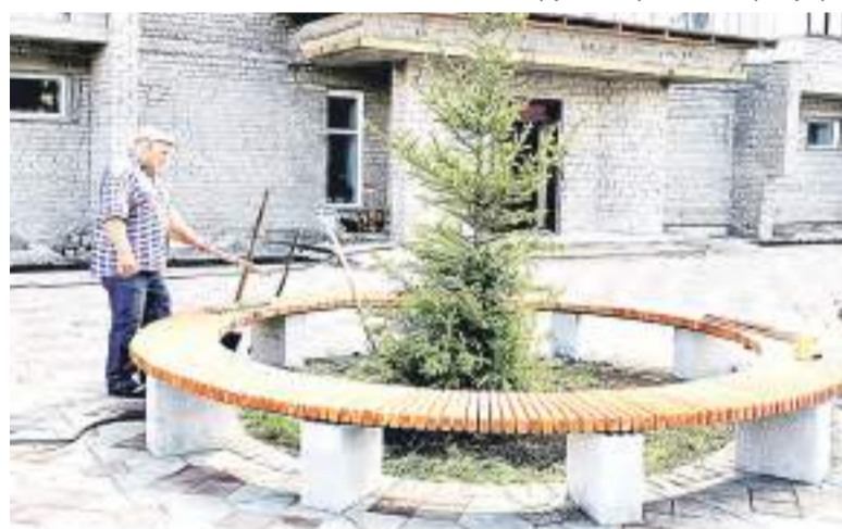
Вот такая красавица ель украшает территорию библиотеки.