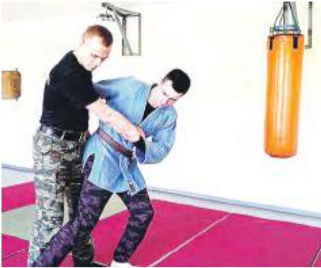
В борцовском зале.

Служба в силовых структурах всегда считалась делом людей крепких духом и телом. А еще – настойчивых и целеустремленных. Именно такие качества нужны тем, кто выбирает для себя работу в уголовно-исполнительной системе.