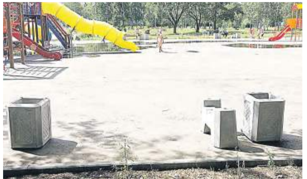
Это все, что осталось от лавочки в сквере Победы.