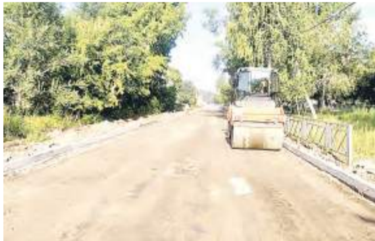
Идет укладка асфальта на южной стороне проспекта Рубцовского.