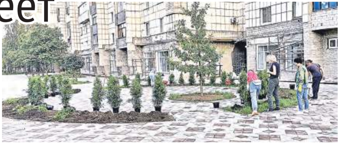
Когда туя разрастется, станет живой изгородью.

уже следующей весной своими зелеными листьями они радовали рубцовчан. Деревья тоже подорожные, должны хорошо укорениться.