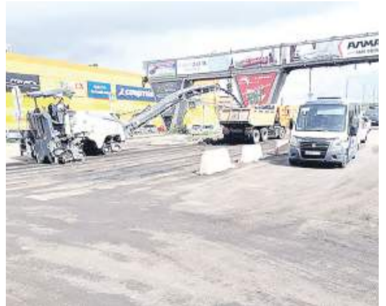
Ремонт кольца у ТЦ «Радуга».

Также продолжают работы на улице Тракторной. Здесь дорожники трудятся сразу на нескольких участках. Начата подготовка к ремонту кольца у ТЦ «Радуга», на объекте работает фрезерная машина, идет подготовка к установке бордюрного камня. На основном отрезке Тракторной работает тяжелая техника. В настоящий момент