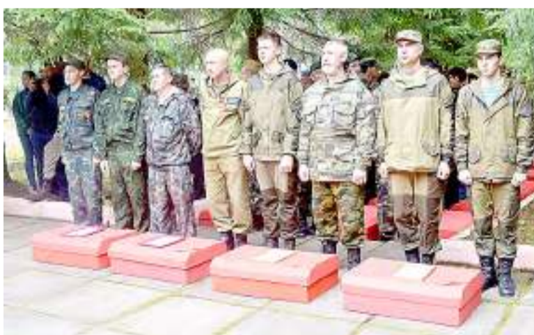
Поисковые отряды выполняют работу, которую трудно переоценить.