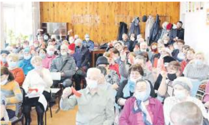
Присутствующие принимали активное участие в работе конференции.