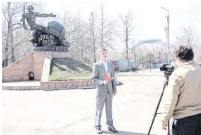
Актер молодежного центра «Экспресс» читает фронтовые письма.

Эти письма – частичка жизни людей, которые поднимали заводы, развивали культуру города. По таким документальным источникам можно изучать историю нашей страны. Из полустёртых строчек, написанных бойцами своим родным между атаками и обстрелами, мы читаем о том, как они бьют врага, что интересовались, как поживают их дети,