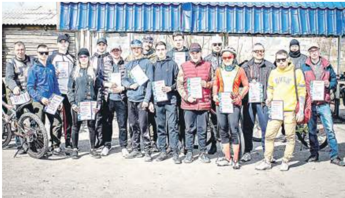
Велосипедисты покорили маршрут примерно в 60 километров.