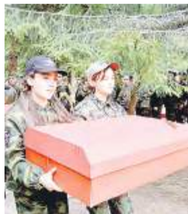
Место захоронения бойцов.

Вера БРЮХАНОВА, фото автора и предоставленные МРПО «Поиск»