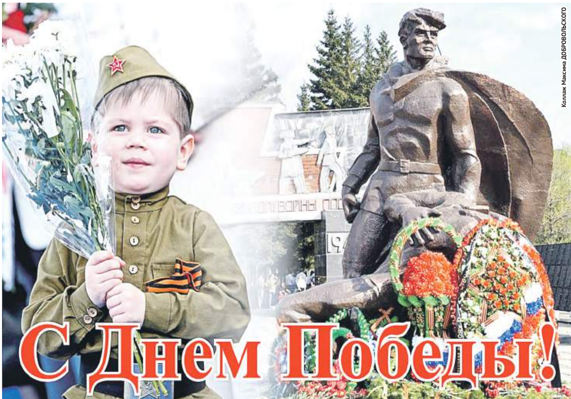
Коллаж Максима ДОБРОВОЛЬСКОГО