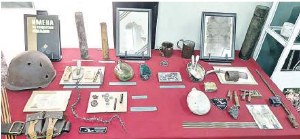
Выставка найденных вещей бойцов.