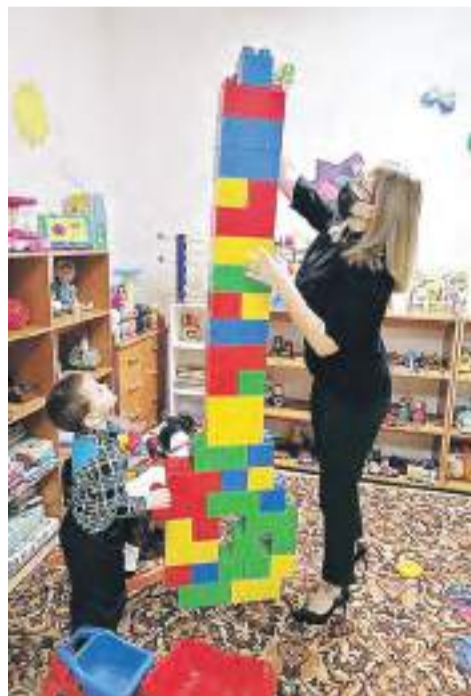
Кабинет реабилитации в Комплексном центре г. Славгорода.

Реабилитологи комплексных центров получают профессиональное сопровождение и организационно-методическую помощь в Ресурсном методическом центре, который открыт в 2022 году на базе краевого центра «Журавлики».