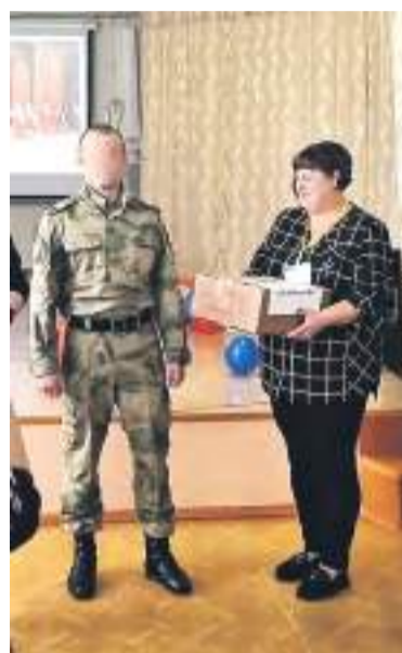
Гуманитарную помощь передали представителю войсковой части.