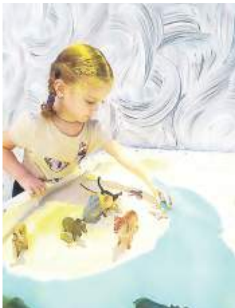
Реабилитационное занятие с использованием интерактивной песочницы (КРЦ «Родник»).

На протяжении восьми лет в регионе действует государственная программа «Доступная среда в Алтайском крае», направленная на повышение уровня доступности социальных объектов для людей с инвалидностью в таких сферах, как здравоохранение, образование, социальная защита, культура, спорт, информация и связь, транспортная и пешеходная инфраструктура. Координатором программы является Министерство социальной защиты Алтайского края.