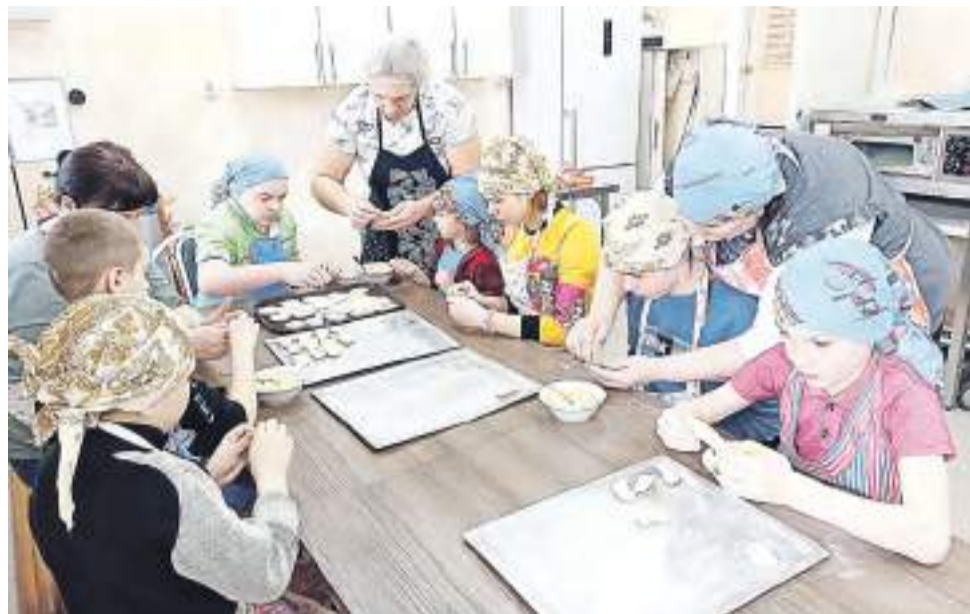
Социально-бытовым навыкам обучают детей с ОВЗ в жилом модуле «Кухня».

На базе Ресурсного центра функционирует коррекционный онлайн кабинет как часть системы непрерывного сопровождения семей с детьми с ограниченными возможностями. Его работа направлена на повышение доступности услуг опытных реабилитологов. Записаться на консультацию логопеда, дефектолога или психолога семьи могут в комплексных центрах по месту жительства или по активной ссылке на сайте центра «Журавлики».