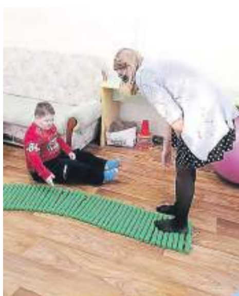
Домашний Микрореабилитационный центр «Журавлик» (г. Славгород).

За все время работы коррекционного онлайн кабинета более 20 семей из пяти районов Алтайского края получили консультации логопеда и дефектолога; более десяти семей, нуждающихся в непрерывном сопровождении, получают пролонгированное консультирование; восемь семей направлены в краевые реабилитационные центры для детей с ОВЗ для получения специализированных услуг в стационарной форме социального обслуживания.