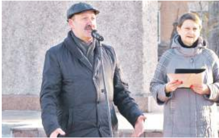
На встрече комсомольцев выступил Глава города Дмитрий Фельдман.

водятся различные важные для города мероприятия, здесь собираются несколько поколений горожан для совместного отдыха. В уходящем году состоялось благоустройство территории в рамках реализации программы «Формирование комфортной городской среды» национального проекта «Жилье и городская среда». На территории появились зоны отдыха и современное освещение, асфальт заменила плитка, старые деревья сменили молодые саженцы и многолетние растения.