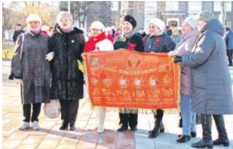
Не стареют душой комсомольцы!