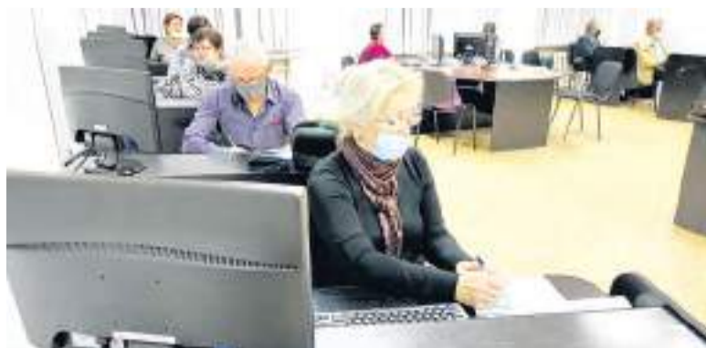
Курсы компьютерной грамотности на базе Рубцовского индустриального института.