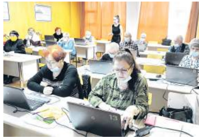
Курсы компьютерной грамотности на базе Рубцовского института (филиала) АлтГУ.

Подобные курсы очень нужны, есть много незатронутых тем. Знаю, что было много людей, которые не смогли попасть на обучение. И это очень жаль. Потребность есть, надеюсь, что проект получит дальнейшее развитие.