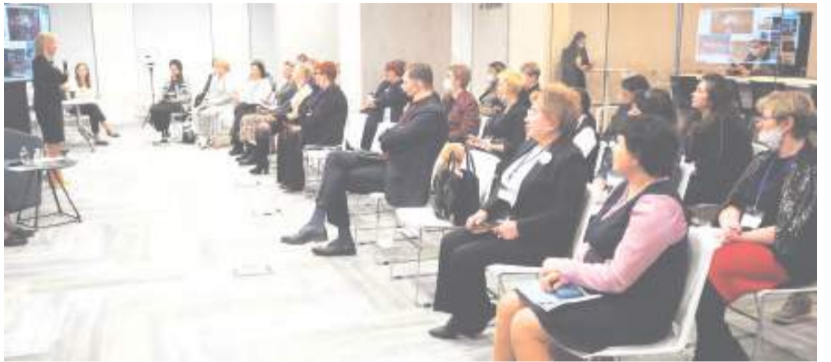
Представители почти тридцати регионов приняли участие в работе форума.

Все мероприятия проходили как в здании Союза женщин России, так и на площадке лабораторий ВЭБ РФ. Во время работы форума состоялись показательные тренинги по продвижению бизнеса на онлайн-платформах. Спикерами были ведущие специалисты и эксперты ВЭБ РФ, фонда