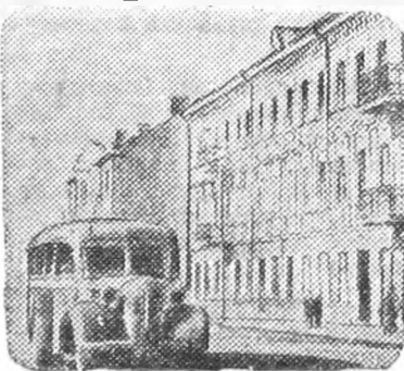
Псков. Восстановленный жилой дом на Октябрьской улице.

Затем на специальном автомобиле их перевезли на центральную базу «Зооцентра».