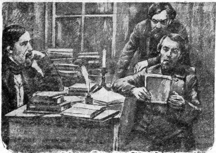
Н. А. Некрасов, И. И. Панаев и В. Г. Белинский в редакции «Современника».

На вечере силами артистов гордрамтеатра будет дан тематический концерт, посвящённый Белинскому.