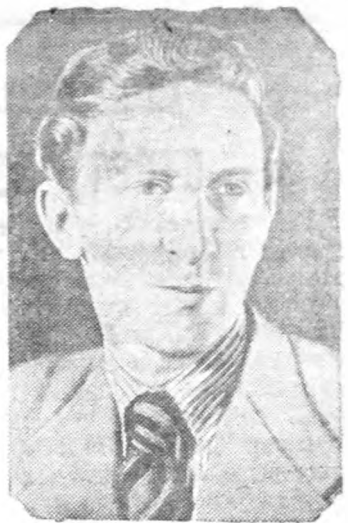
В. В. Смыслов, — гроссмейстер СССР, занявший второе место в матч-турнире на первенство мира по шахматам.