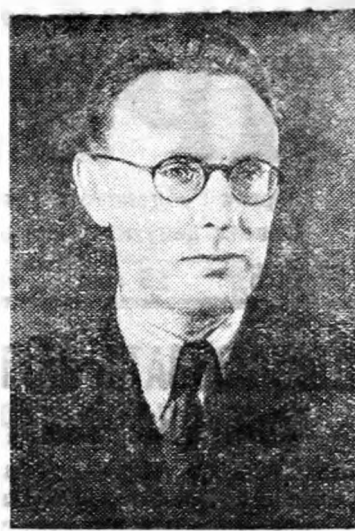
Закончился матч турнир на первенство мира по шахматам. На снимке: Чемпион мира по шахматам, гроссмейстер М. М. Вотиавник.

прокурор гор. Рубцовска, мл. советник юстиции.